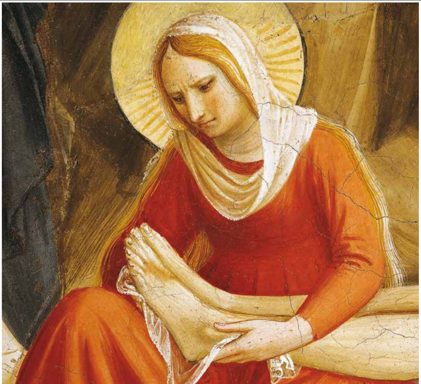
Die Beweinung Christi.

Tonfall Seiner Stimme mitteilte – das ist die Neuheit, die in die Geschichte eingetreten ist und nach der sich, damals wie heute, jeder Mensch sehnt. Don Giussani sagte auf der Synode über die Frage der Laien 1987: „Der Mensch von heute wartet, vielleicht unbewusst, darauf, Personen zu begegnen, für die das Faktum Christi als Wirklichkeit derart gegenwärtig ist, dass ihr Leben sich verändert hat. Ein derartiges menschliches Zusammentreffen kann den Menschen von heute aufrütteln. Ein Ereignis, das das Echo jenes ursprünglichen Ereignisses darstellt, als Jesus zu Zachäus hinaufschaute und ihm sagte: ‚Zachäus, komm schnell herunter! Denn ich muss heute in deinem Haus zu Gast sein.‘“ (L. Giussani, L'avvenimento cristiano , BUR, Mailand 2003, S. 24)