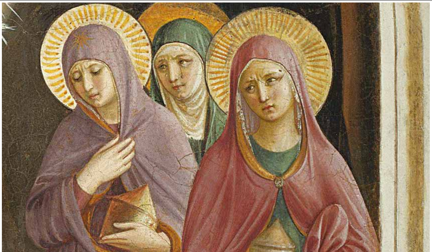
Die frommen Frauen am Grab.

neue Erfahrung einer Zuneigung zu Christus und zum Geheimnis der Kirche, die in unserer Einheit anschaulich und konkret wird. Die Identität ist folglich eine lebendige Erfahrung der Zuneigung zu Christus und zu unserer Einheit.“