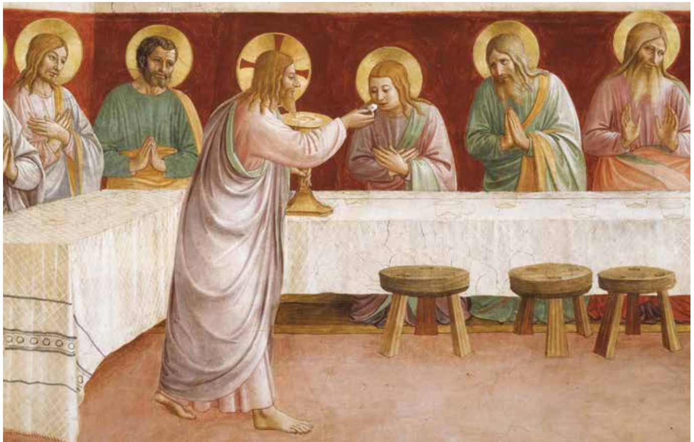
Die Kommunion der Apostel.

unserer Gemeinschaft in diesem Jahr entstanden sind, besonders bei der landesweiten Begegnung der Verantwortlichen von CL in Pacengo. Dort ist für uns alle klar geworden, dass das, was unserem Leben Bestand verleiht, diese Erfüllung ist. Deshalb hat nicht derjenige Gewissheit, der schon alles weiß und es bestenfalls noch den anderen mitteilen muss, für sich selbst aber nichts mehr erwartet – eine gesättigte und hochmütige Gewissheit, könnte man sagen. Nein, unsere Gewissheit ist von Neugier geprägt. Es ist eine Gewissheit im Aufbruch, die uns immer weiter vorantreibt. Ich zitiere nochmals den Brief von Papst Franziskus: „Es wird deutlich, dass der Glaube nicht unnachgiebig ist, sondern im Miteinander wächst, das den anderen respektiert. Der Gläubige ist nicht arrogant; im Gegenteil, die Wahrheit lässt ihn demütig werden, da er weiß, dass nicht wir sie besitzen, sondern vielmehr sie es ist, die uns umfängt und uns besitzt. Weit davon entfernt, uns zu verhärten, bringt uns die Glaubensgewissheit in Bewegung und ermöglicht das Zeugnis und den Dialog mit allen.“ (Ebd. unter Verweis auf Lumen fidei 34)