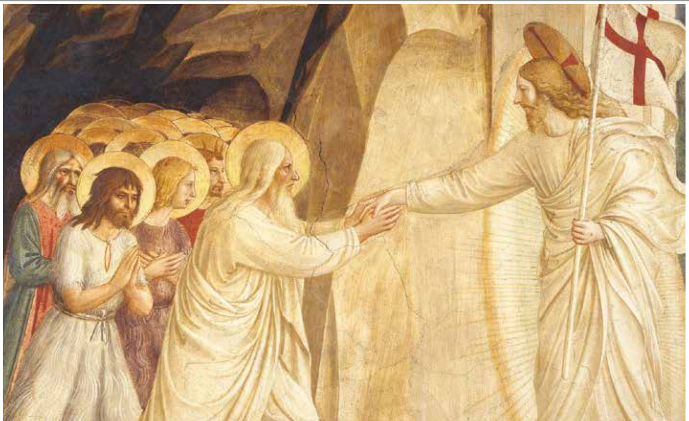
Christus in der Vorhölle.

sich zeigt, um mir die Antwort nahezubringen, um mich auch in meinen dunkelsten Stunden zu begleiten. Das geschieht nach einem Plan, der nicht der meine ist.